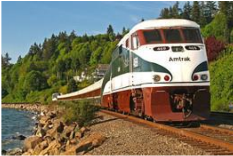
The Amtrak Cascades train that runs between Vancouver, B.C., and Seattle hugs the shore of Puget Sound.