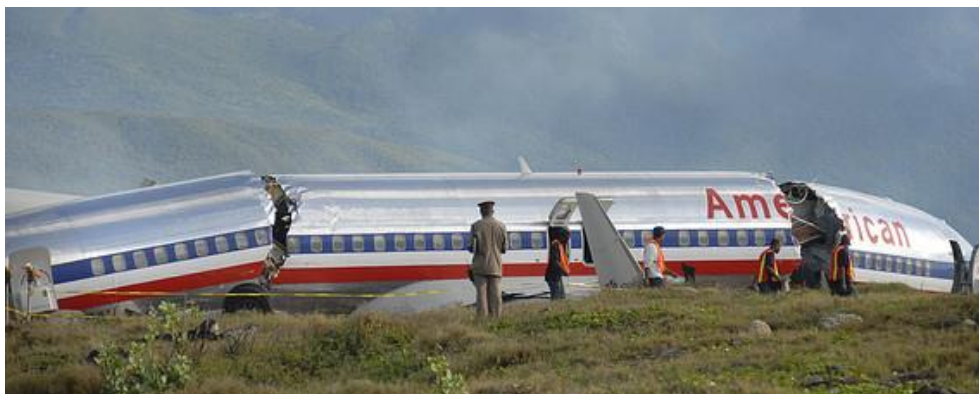
Workers and officials Wednesday sifted through debris surrounding the fuselage of American Airlines flight AA331.

12 月 22 日のマイアミ発キングストン行き AA331 便 (B737-800 型機、乗員 6 名、乗客 148 人) が Norman Manley 国際空港で豪雨下の着陸に失敗し、滑走路を大きくはみ出して海に突っ込む寸前で停止した。 胴体は 3 つに破断し約 40 名が負傷した。 死者は出ていない。 悪天候が原因で滑走路の着地点を通過して着陸し、滑走路端をはみ出してしまふ事故はかなり多く発生している。 1995 年～2008 年までで航空機事故の 30% がこの所謂 “runway excursions” だ。 エアバスは、自動ブレーキ装置とパイロットに対して滑走着地点を警告する装置を開発している。 Honeywell International も、着陸スピードの超過、グライドパスの離脱をパイロットに知らせる音声警報装置を開発している。 しかし最終的にはパイロットの判断と操縦技術が左右する。(nytimes.com, 12/23/2009) (wsj.com, 12/24/3009)