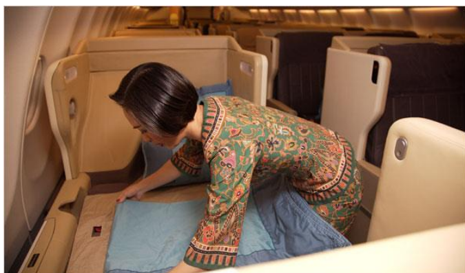
Business class on Singapore Airlines flights includes amenities like seats that fold flat.

ロンドンの品質調査企業 SkyTrax のランキングでは、5 つ星 6 社の航空会社の内 5 社がアジアの航空会社で占められている。 北米の航空会社は数社、欧州の航空会社は 10 社以下が 4 つ星に選ばれているのは好対照だ。 アジアのフルサービス航空会社は、手数料収入をケチケチ取らずにサービス品質を維持している。 CX は、最近、長距離便の座席指定料金 $100 を徴収し始めたが、これはアジアの航空会社の標準とは決してならないだろう。(nytimes.com, 12/25/2009)