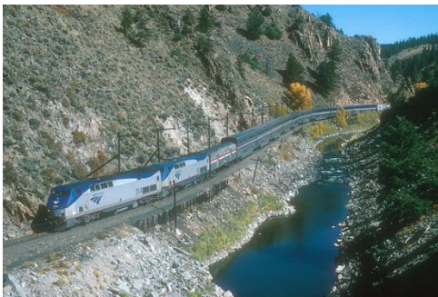
The California Zephyr follows the upper Colorado River through Byers Canyon in Colorado