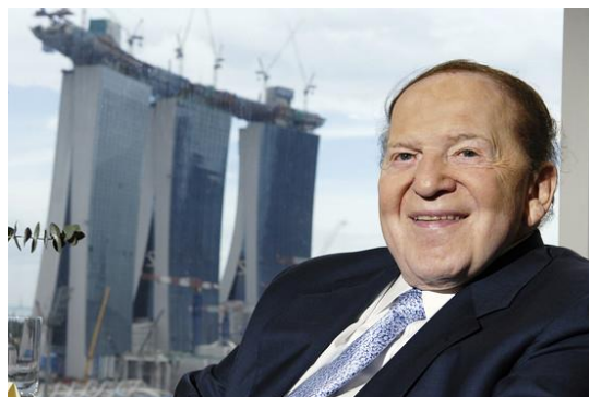
Sheldon Adelson, chairman and chief executive officer of Las Vegas Sands Corp., speaking in Singapore Monday with the Marina Bay Sands resort in the background.

Las Vegas Sands は、現在マカオで Sands Macao, Plaza カジノ、Venetian Macao リゾートホテルを運営し 3,500 室の客室と 1,000 台の賭博テーブルと 3,600 台のスロットマシンを運営している。 同社は、シンガポールの Marina Bay Sands ($5bn プロジェクト) を 2010 年の 4 月の初めにオープンする。(wsj.com, 12/22/2009)